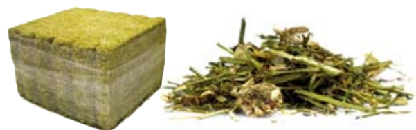
en balles de 420 kg, cerclage plastique (1m15 x 1m15 x 0m72)